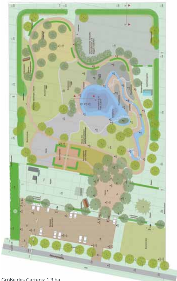
Größe des Gartens: 1,3 ha