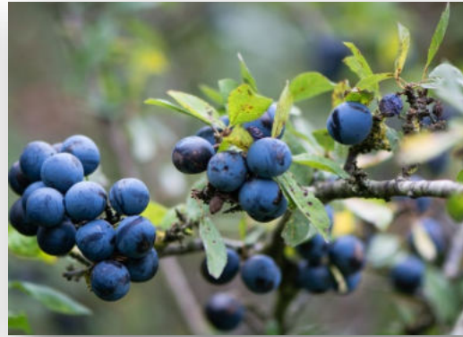
Schlehe / Schlehdorn ( Prunus spinosa ) Blüte / Frucht