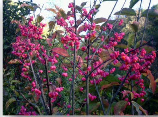
Pfaffenhütchen / Gewöhnlicher Spindelstrauch ( Euonymus europaeus ) Blüte / Frucht