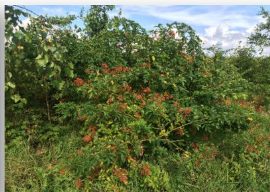
Hecken-Rose ( Rosa corymbifera ) Blüte / Frucht